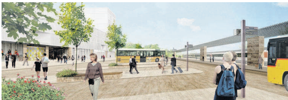
La future place commerçante de la gare de Rolle telle que l'a imaginée le lauréat du concours.