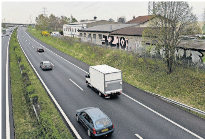
Les bâtiments enclavés entre la bretelle de l'autoroute et l'A1 devront être démolis. La propriétaire cédera son terrain à Schenk quand les locataires seront relogés. PATRICK MARTIN

Cela dit, les délais annoncés en novembre dernier sont déjà déca-