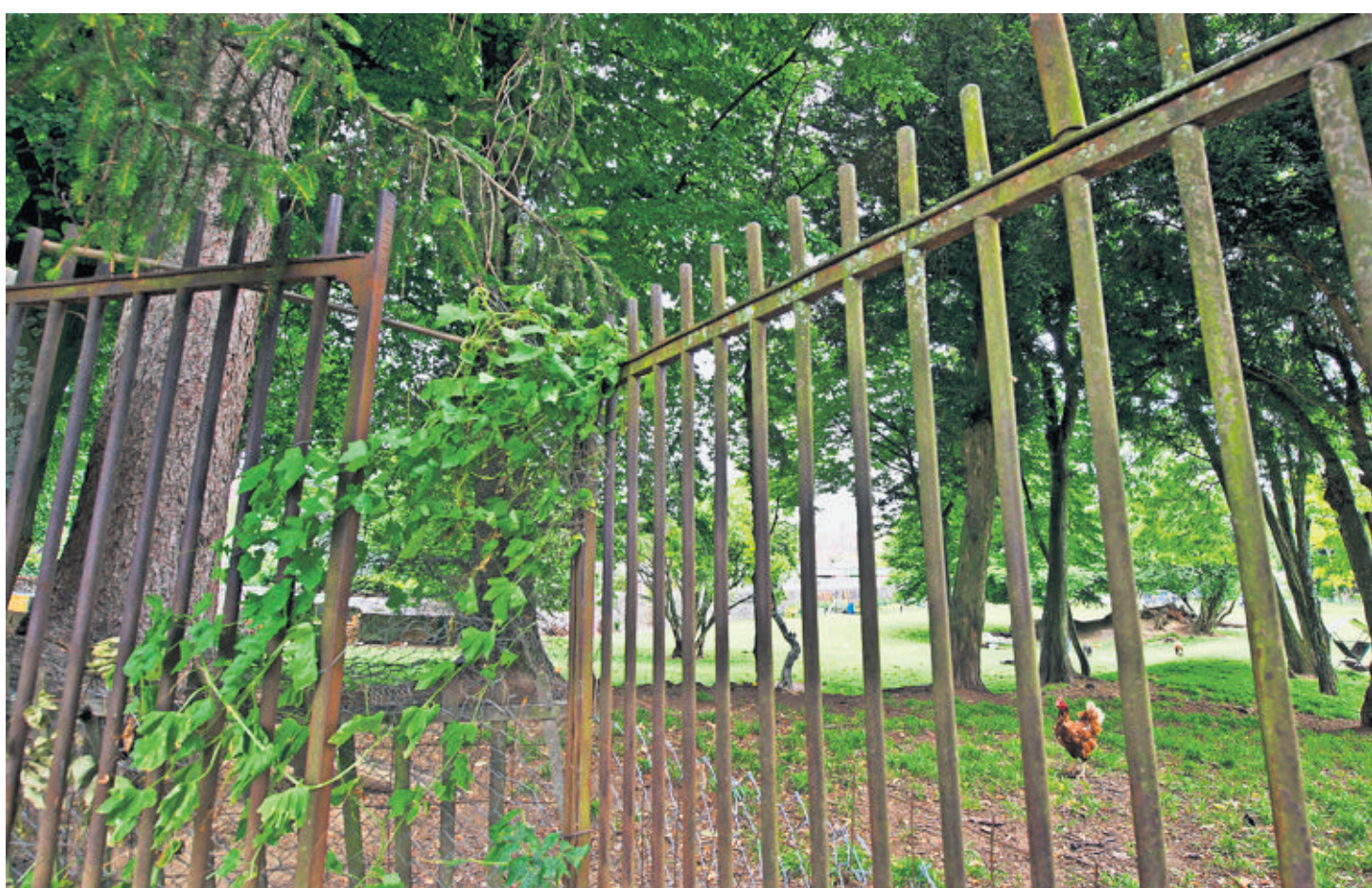
Aujourd'hui propriété de la famille Veyrassat, ce magnifique espace vert deviendra un parc ouvert au public. VANESSA CARDOSO