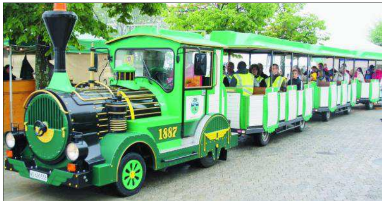
Le petit train de Nyon a arpenté la ville.