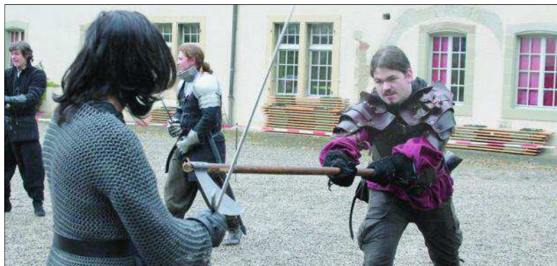
Duel entre deux combattants de l'Académie Némésis dans la cour du château, revenu à l'époque médiévale. A l'intérieur, la Guilde du Chevalier de Fer proposait des animations d'époque et une belle collection d'armes.