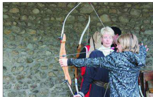
Les archers amateurs pouvaient s'exercer dans la cour du château.