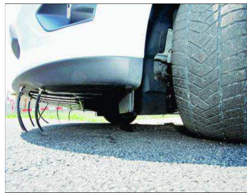
Sous le capot de ce véhicule, des buses permettent de détecter de minuscules fuites de gaz. On en a compté près d'une trentaine cette année, dont la totalité sera réparée d'ici la fin du mois. Il faut un jour et demi pour vérifier l'ensemble du réseau rollois.