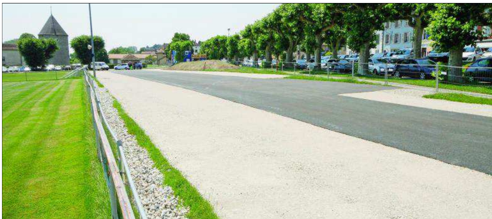
Une vue de la partie Nord du parking provisoire «Au Parc», qui ouvrira prochainement. Contrairement aux projets initiaux, les terrains d'entrainements de football ont pu être largement préservés. De la place supplémentaire pour les spectateurs aux abords des terrains a également pu être dégagée.