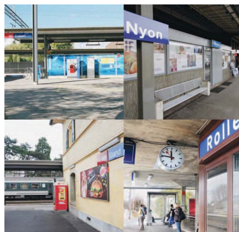
La signature de la lettre d'intention est le feu vert pour le développement des quatre gares régionales, de Rolle, Gland, Nyon et Coppet. Un projet novateur et unique dans le canton de Vaud.