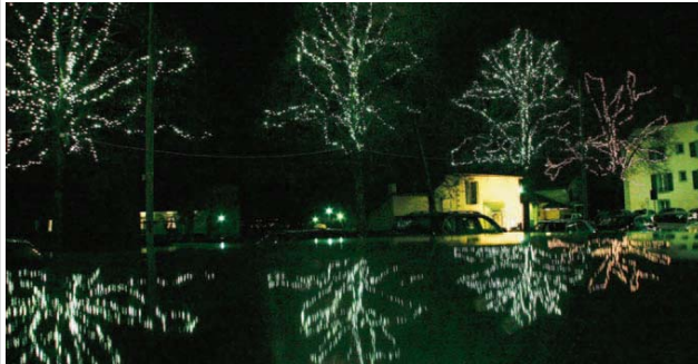
tous les commerces et entreprises rollois ont été invités à présenter leurs produits ou activités sur la Grand-Rue.