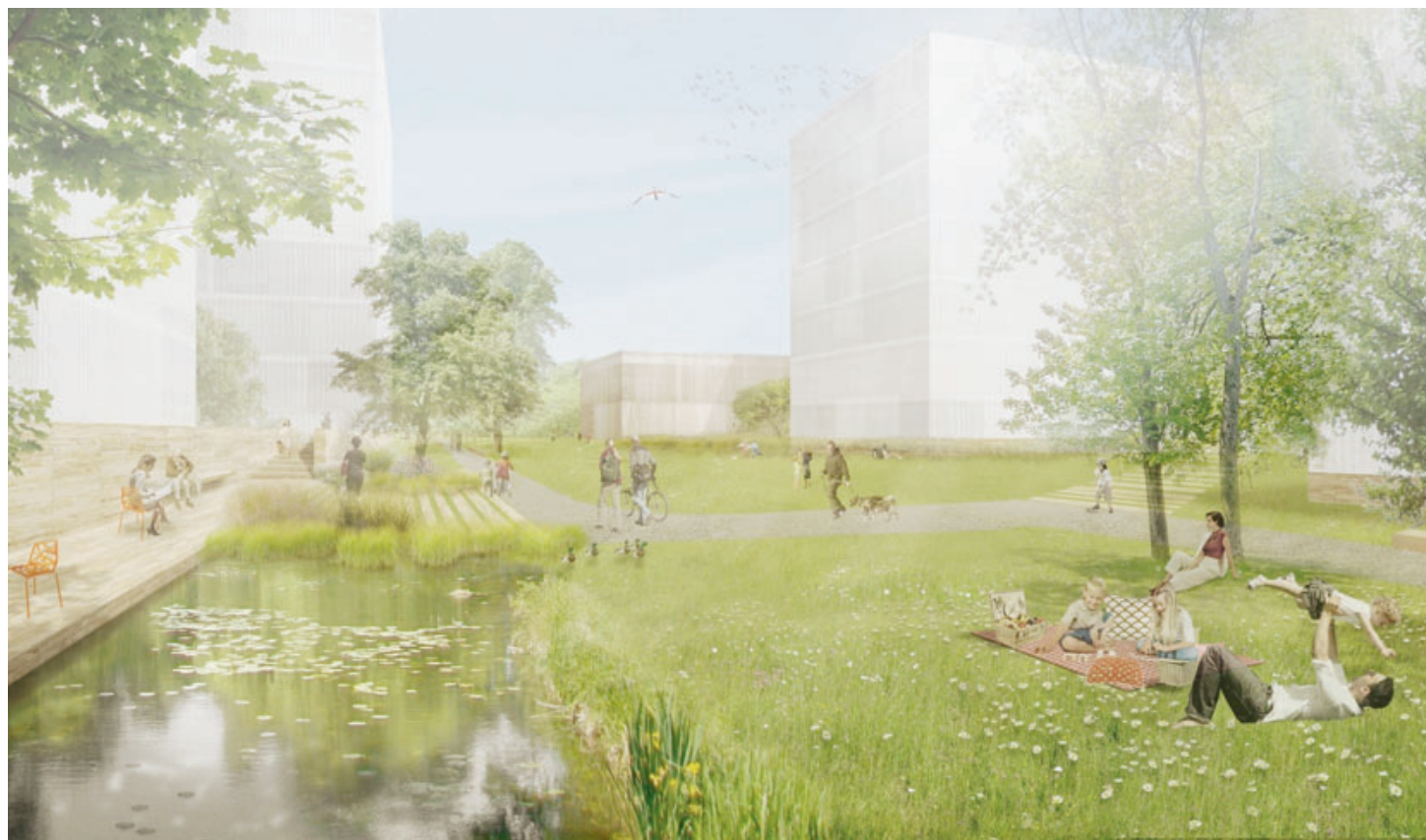
Intitulé «Les Strates», le projet lauréat prévoit un parc naturel où les habitants et voisins pourront venir se détendre. CCHE ARCHITECTURE ET DESIGN

Pour tous les deux, les spécificités de ce concours auront été la longueur – neuf mois de travail contre trois mois pour un concours «standard» – et la densité souhaitée du quartier comme le plus gros enjeu. «Une telle concentration n'existe pas à Rolle, a expliqué Françoise Tecon, municipale en charge notamment