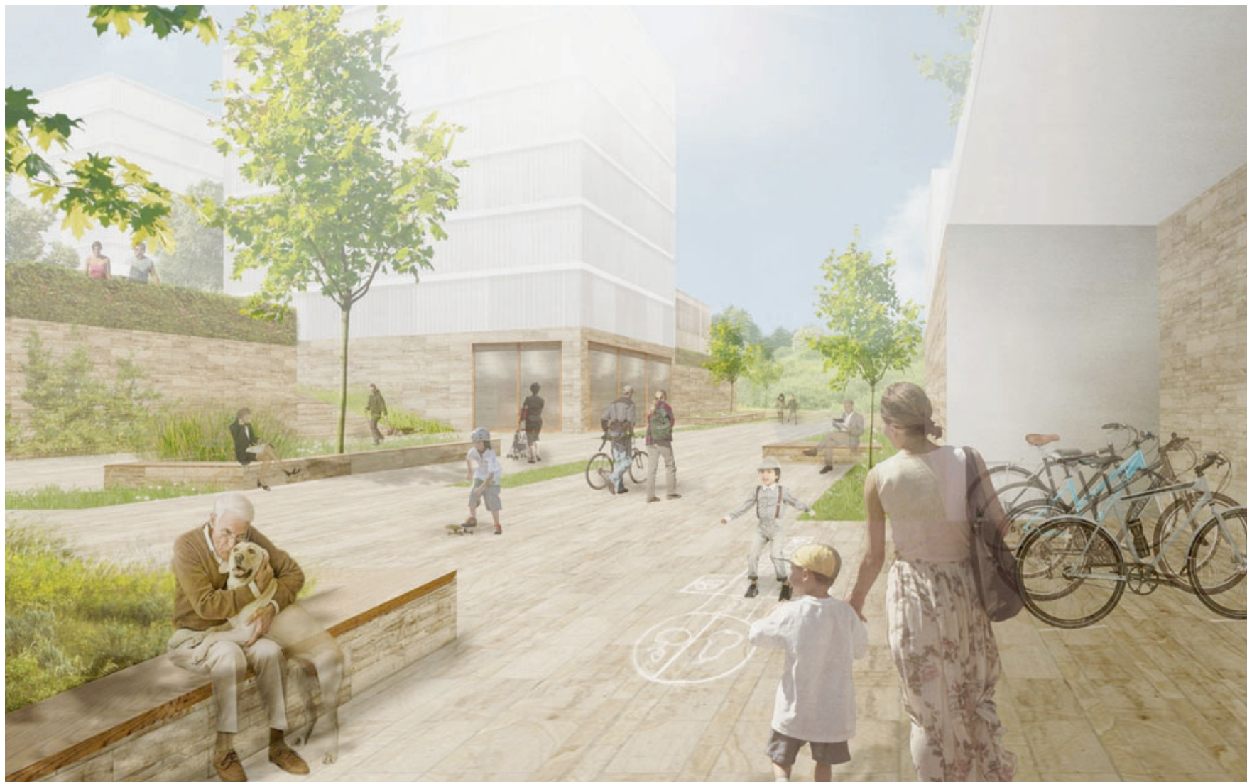
CHE ARCHITECTURE ET DESIGN

ROLLE Le secteur entre la gare et l'autoroute va totalement changer de visage dans les cinq prochaines années. A la suite de la volonté des caves Schenk de se regrouper dans un nouveau bâtiment au nord du site, des logements et commerces grandiront sur l'espace laissé libre. Le projet est à découvrir jusqu'à jeudi au château de Rolle. PAGE 5