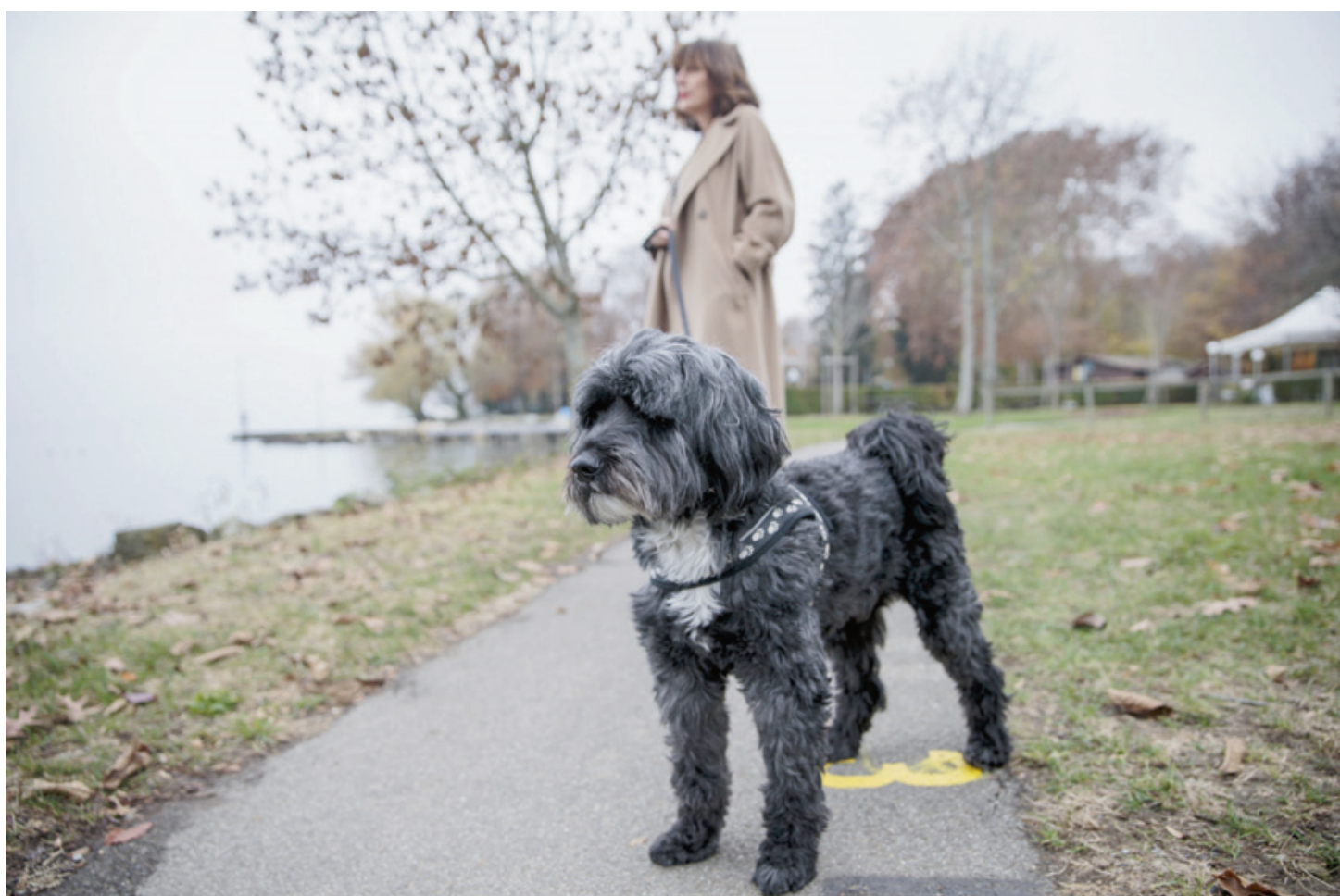
De la mort-aux-rats était déposée sur la parcelle du camping de Rolle. Mardi 20 novembre, un chien, qui a eu moins de chance que celui sur notre image, en a ingurgité. Il a pu être sauvé après l'intervention urgente d'un vétérinaire de la place. SIGFREDO HARO - IMAGE D'ILLUSTRATION

L'affaire a immédiatement été prise au sérieux. Moins de cinq minutes après le passage de la propriétaire du chien auprès des gendarmes, une importante opération de recherche