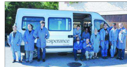
Toute l'équipe des ateliers Multiservices de l'Espérance se réjouit d'offrir un nouveau service aux Rollois.

Les éléments pris en charge doivent être triés et recyclables. Leur volume est limité à l'équivalent de trois sacs de 110 litres. Une liste exhaustive des éléments admis est disponible sur le site internet communal, à la rubrique «déchets». On y retrouve le PET, les