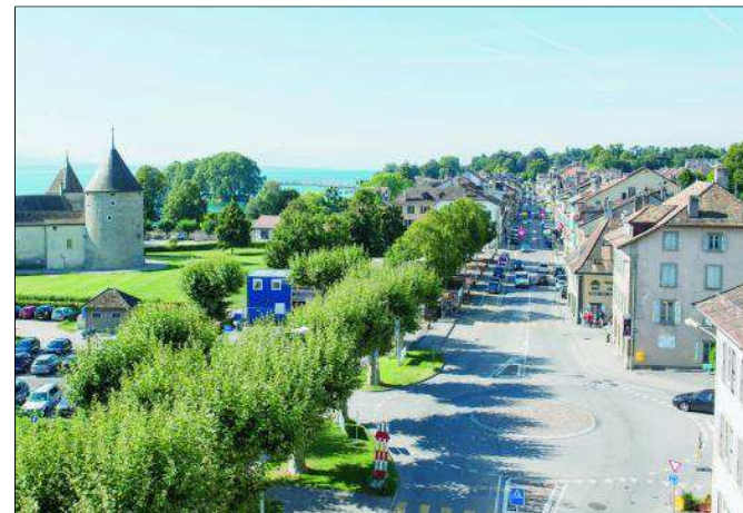
En perspective, la Grand-Rue à l'aube de sa métamorphose avec, au premier plan, le giratoire permettant la déviation durant les travaux.